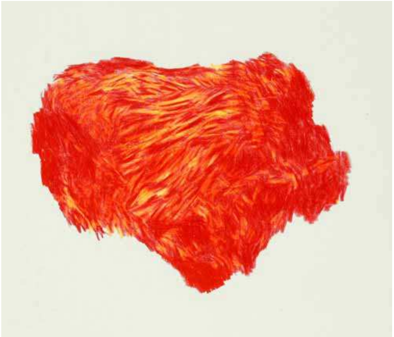
Red 13, kleurpotlood, 2013, 29,7 x 21 cm

Krantenartikel UP STREAM Jaak Vandermosten April – Mei 2013 - n°10