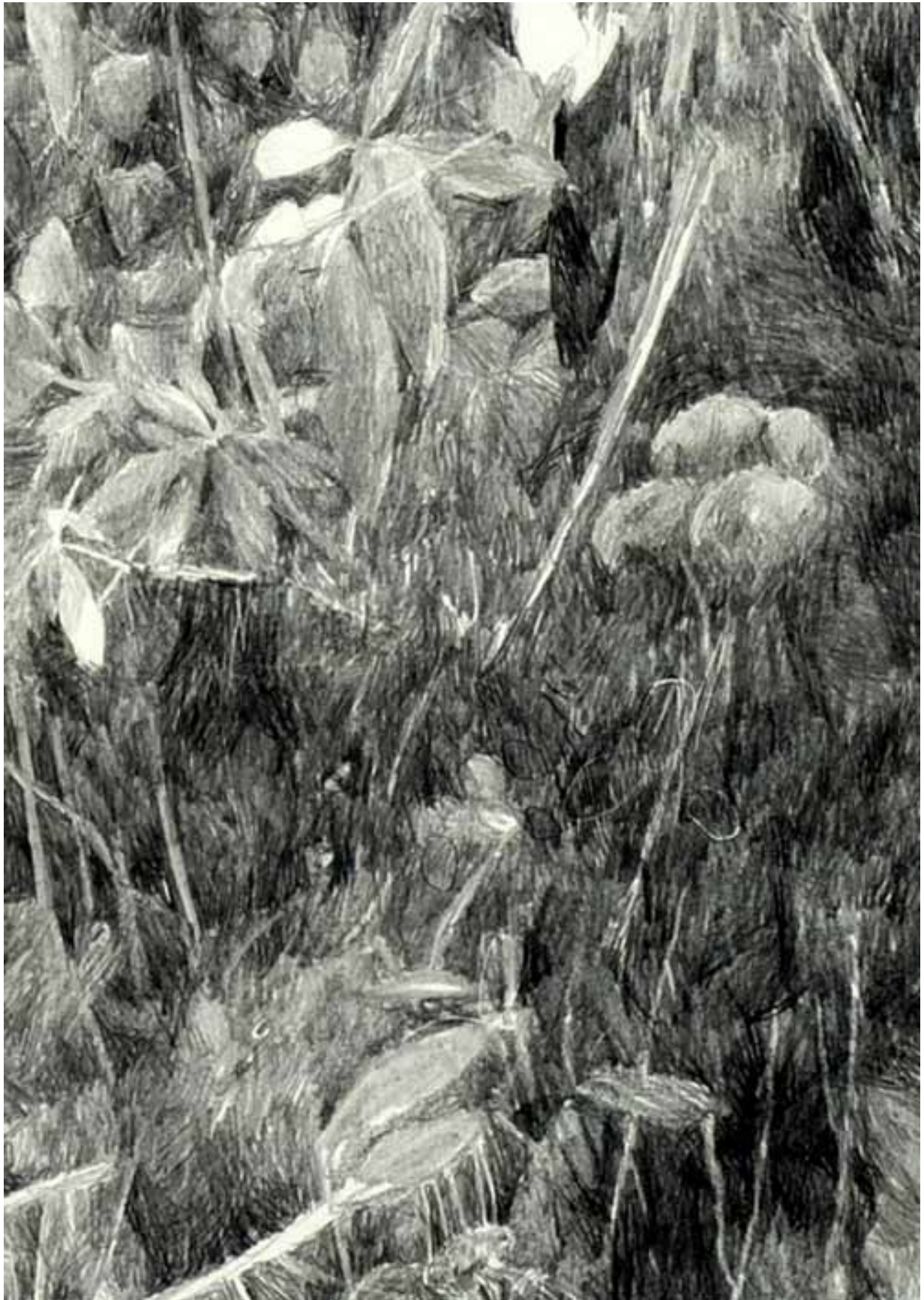
17h39 – 21.10.2010 (detail), grafietpotlood