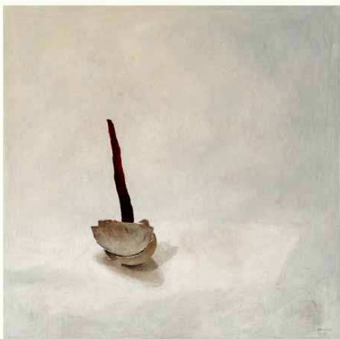
Pas dit, droge pastel, 2004, 77 x 77 cm

Het potloodgrijs mag het recente werk dan wel uitgesproken kenmerken, soms is er nog ruimte voor kleur - niet meer die zachte rustige kleuren - maar wel onder de vorm een groot aantal krachtige kleurenstreepjes, gebundeld in de vorm van een tuil zoals in de serie 'Red'.