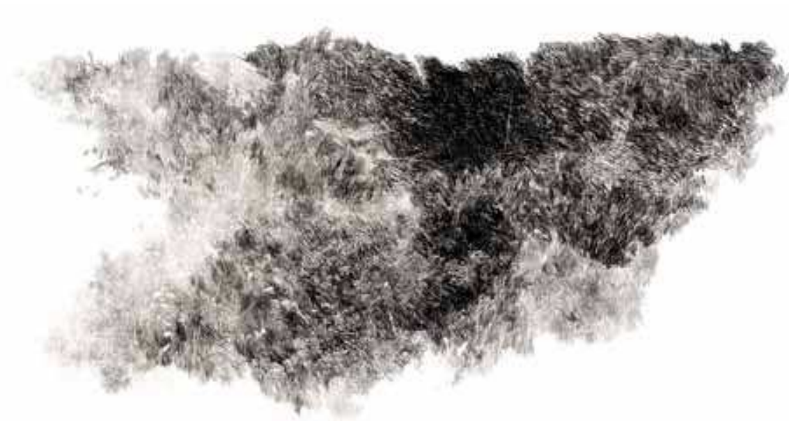
Isola 4, grafietpotlood, 2011, 50 x 70 cm